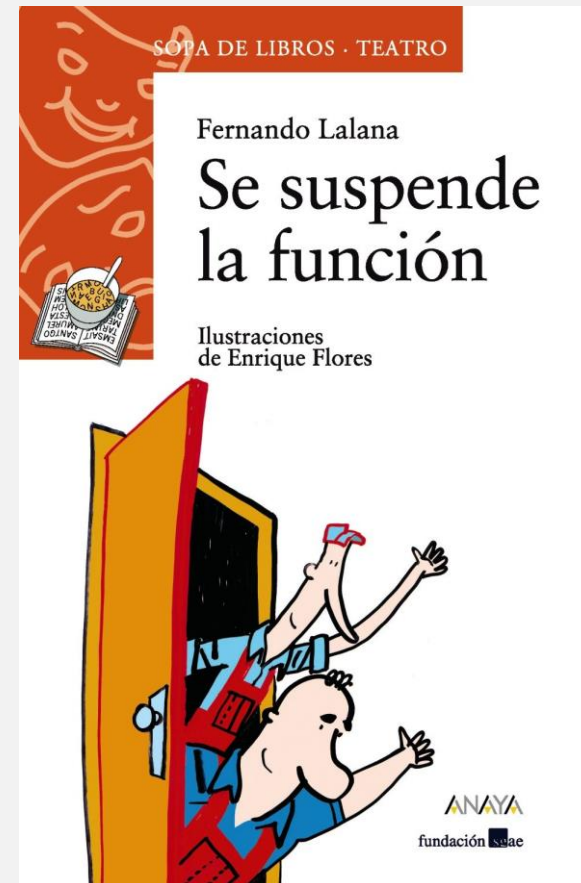
Portada del libro editado por ANAYA infantil y juvenil©

Bien, estimados amigos, jóvenes espectadores, amado público... ¡Ejem...! Esto... ¿Podría alguien explicarme qué deminosios estáis haciendo aquí? Porque... ¿no habréis venido, por casualidad, a ver una función de teatro?